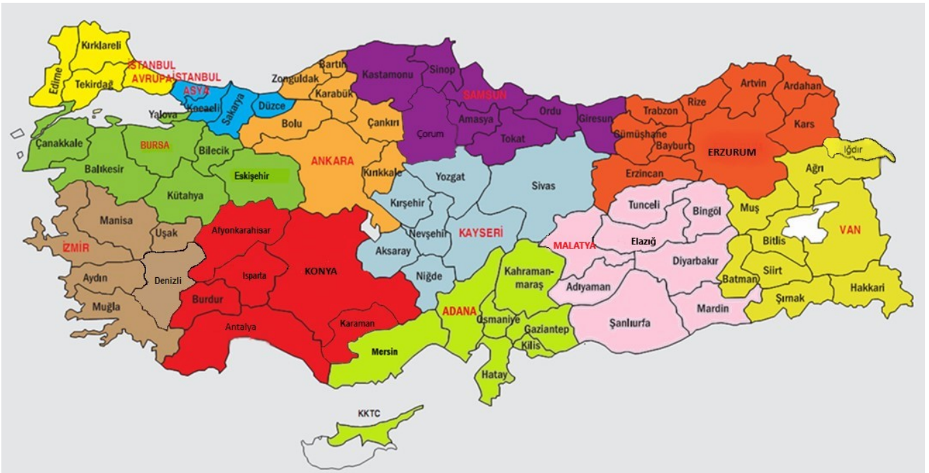
Şekil 1. Yarışma Bölgeleri Haritası

Bu yarışma Türkiye genelinde 12 bölgede yapılmaktadır. Her bölge için bir il, merkez olarak seçilmiştir. Her bölgeye il merkezinden iki öğretim üyesi, TÜBİTAK tarafından yarışmalardan sorumlu Bölge Koordinatörü ve Bölge Koordinatör Yardımcısı görevlendirilir. Adana, Ankara, Bursa, Erzurum, Konya, İstanbul Asya, İstanbul Avrupa, İzmir, Kayseri, Malatya, Samsun ve Van bölge merkezi illerdir. İllerin bölgelere dağılımları Şekil 1’de verilmiştir.